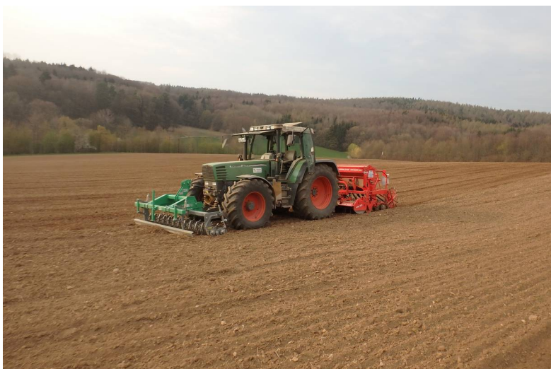
Lein-Aussaat mit geliehenem Schlepper auf 30-Acker.

Grüngut-Kompost bindet Stickstoff und soll zum Humus-Aufbau beitragen. Auf Grund der zunehmenden Frühjahrs-Trockenheit haben wir uns für eine Blanksaat entschieden. Bisher haben wir das Luzerne-Klee gras im Frühjahr mit dem Striegel in den Winterroggen gesät, dies funktioniert aber nicht mehr immer zuverlässig.