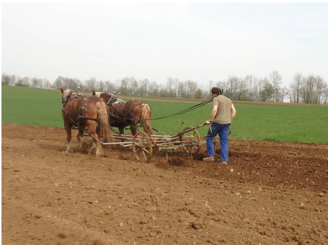
Aufhäufeln der Kartoffeldämme mit dem Stoll Vielfachgerät und unseren Pferden Isis und Fritz.

einmal. Der Reihenabstand beträgt 75 cm, der Abstand in der Reihe ca. 40 cm. Direkt nach dem Pflanzen der Kartoffeln werden die Dämme aufgehäufelt, damit alle Kartoffeln gut mit Erde bedeckt sind.