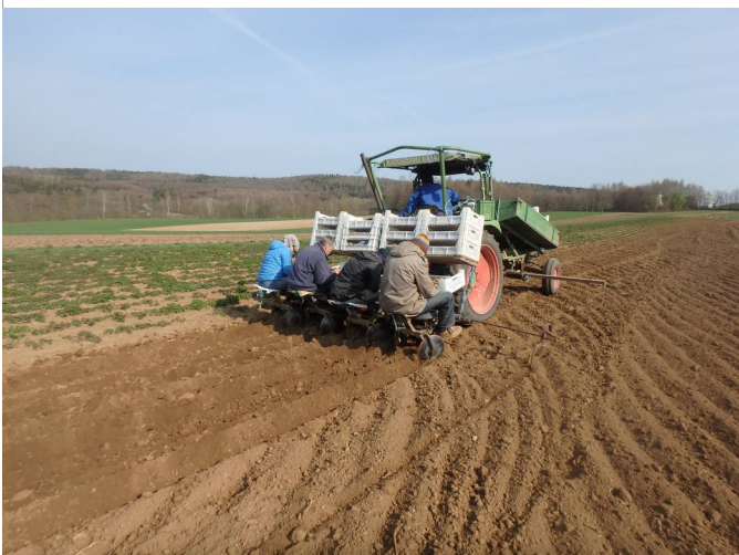
5 Mitarbeiter werden zum Kartoffelpflanzen benötigt.