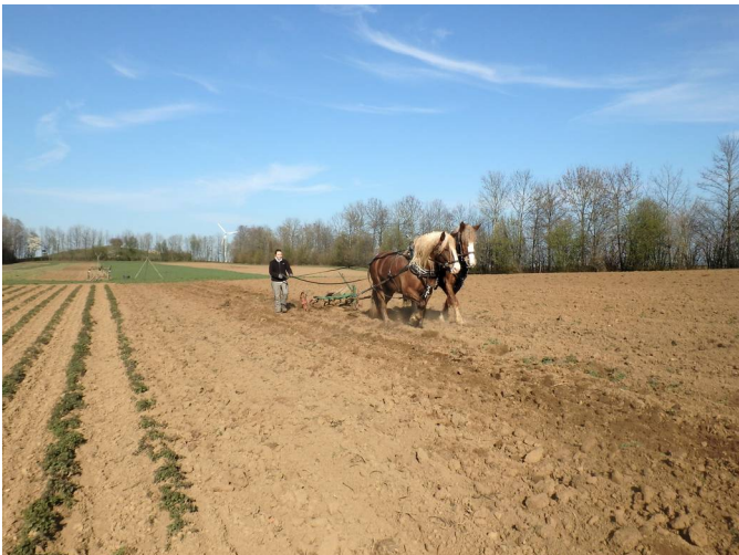
Zuerst wird das Land (hier neben der Brennnessel) gegrubbert, dabei wird der Boden gelockert, ohne ihn zu wenden.