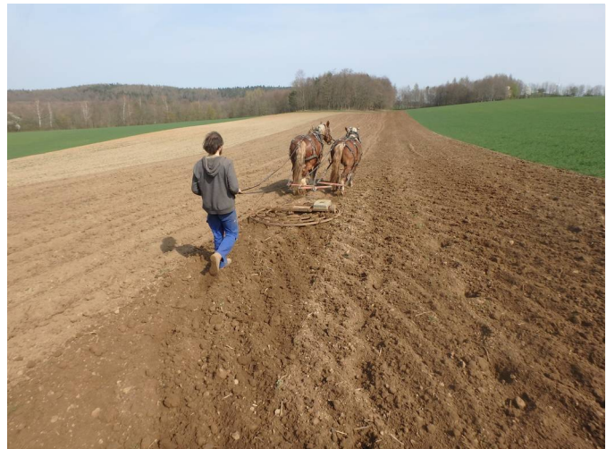
Mit der Runderge wird der Boden anschließend eingeebnet und Kluten (Erdklumpen) zerkleinert. Die Runderge dreht sich beim Arbeiten, weil durch das aufgelegte Gewicht die Zinken unterschiedlich tief in den Boden greifen. (Hier ist das ganze Feld für die späten Lagerkartoffeln zu sehen. Nur oben werden wir gleich 8 Reihen frühe Anuschka pflanzen.)

In der ersten Aprilwoche, am Dienstag den 2., haben wir die Frühkartoffeln Solist und Anuschka gepflanzt – so früh wie noch nie.