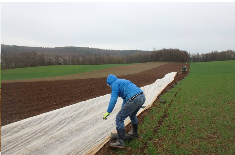
Vlies auflegen und beschweren mit Sandsäcken

Am nächsten Morgen haben wir die Kartoffeldämme auf beiden Feldern mit Vlies abgedeckt, damit der Boden sich schneller erwärmt und nachts nicht so auskühlt. So wachsen die Frühkartoffeln deutlich schneller und bekommen einen Wachstumsvorsprung von mehreren Wochen. Das Vlies ist wasser-, licht- und winddurchlässig. Mit Sandsäcken beschweren wir beide Seiten, damit das Vlies nicht weggeweht wird. Den Gewittersturm haben sie so gut überstanden.