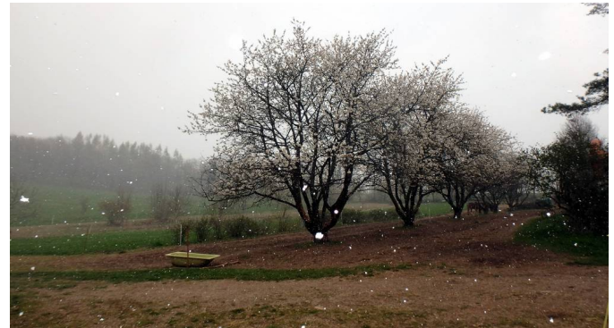
Bei Temperaturen von -2°C und Schneefall steht die Kirschernte in Frage.

Wir haben uns über Eure Rückmeldungen zum Rundbrief und bezüglich der bevorzugten Anrede gefreut: Alle haben sich für das persönliche „Du“ ausgesprochen.