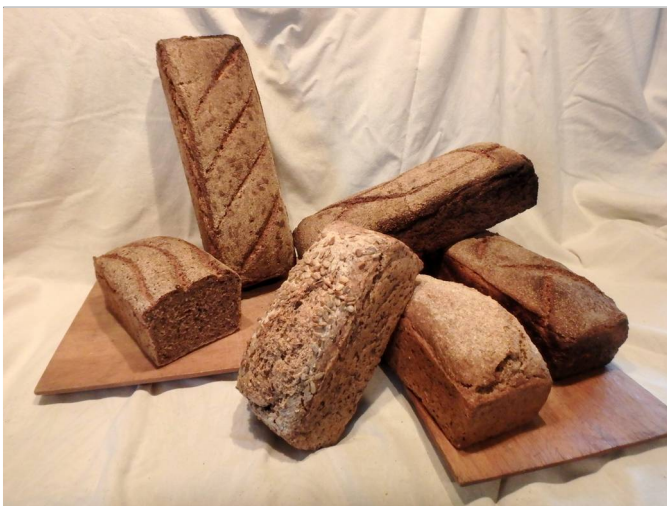
Unser Sauerteigbrot aus dem Holzofen mit eigenem Getreide und glutenfreies Sauerteigbrot aus Buchweizen. Mit Liebe & und viel Handarbeit gebacken.

Die Besuche des Backkurses und bei der Holzbackofen-Firma Häußler im Februar haben sich ausgezahlt, wir haben den alten Holzofen von 1925 im Backhaus nun verstanden: Es gelingt uns nun, den Ofen lang genug mit der richtigen Temperatur zu halten, so dass das Brot nicht mehr zu dunkel wird. Wir danken für Eure Geduld und euer Verständnis! Nur durch mehrere Male backen konnten wir den Ofen kennenlernen, verstehen und durchdringen. Und wir selbst mussten auch jede Menge lernen. ☺