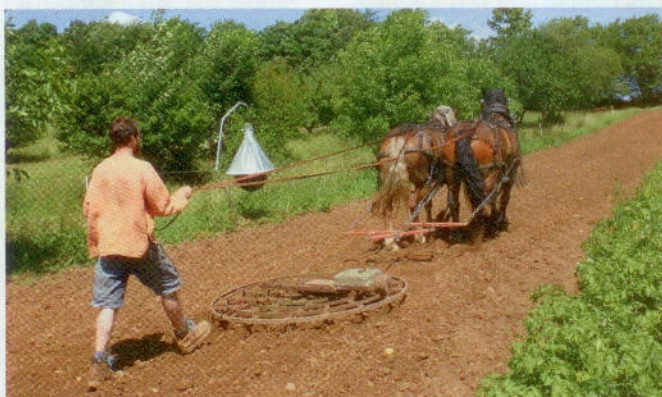
Kayßers Rundegge im Einsatz. Neben dem Acker eine Bremsenfalle, die Plagegeister von den Pferden fernhalten soll.

Weiterhin gehört zur Ausstattung ein Fahr-Mähwerk Nr. 3 und ein McCormick D10 mit 1,50 Meter-Mähbalken sowie