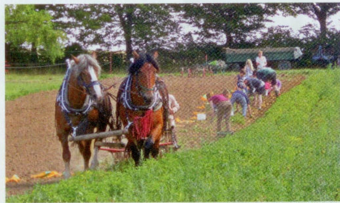
Ernährungsbildung auf dem Acker: Für Schulklassen wird ein Kartoffelprojekt vom Setzen bis zur Ernte angeboten. Die Kartoffelernte mit Pferden ist außerdem ein besonderes Erlebnis für Groß und Klein.