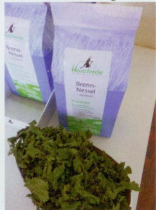
Brennesselkraut vom Tannenhof wird unter anderem von Heuschrecke Naturkost GmbH vermarktet.