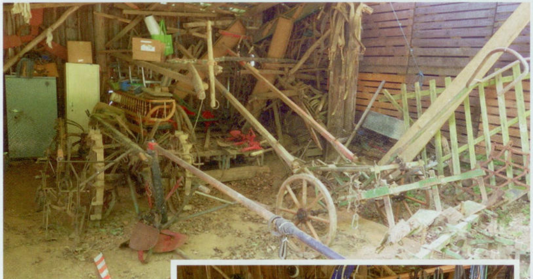
Diverse Pferdegeräte lagern trocken in der Scheune, z.B. Schleuderradroder und Vielfachgerät.