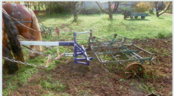
Ein Dreipunktadapter ermöglicht die Nutzung von Treckergeräten für den Pferdezug - ohne Vorderwagen.