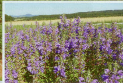
... (links) eignet sich sehr gut als Gewürz für Brot, Käse, Kräuterquark, Kartoffelgerichte und Salat. Aus Lein (zweiter v.l., mit Mohnblume) werden Leinsamen und (Mitte) wird Speiseöl gewonnen. Eine Dahlie als Farbtupfer (zweite v.r.) leuchtet mit dem Teekraut Drachenkopf (rechts) um die Wette.

Sohn Johannes ist inzwischen übergangsweise zur Miete ins Gästehaus der Kommunität gezogen und plant den zukünftigen Bau eines eigenen Wohnhauses und Pferdestalls auf dem Tannenhof. Er sucht momentan aktiv nach Mitstreitern, die langfristig eine Hofgemeinschaft aufbauen wollen. Damit die Pferdearbeit sich finanziell lohnt, soll eine