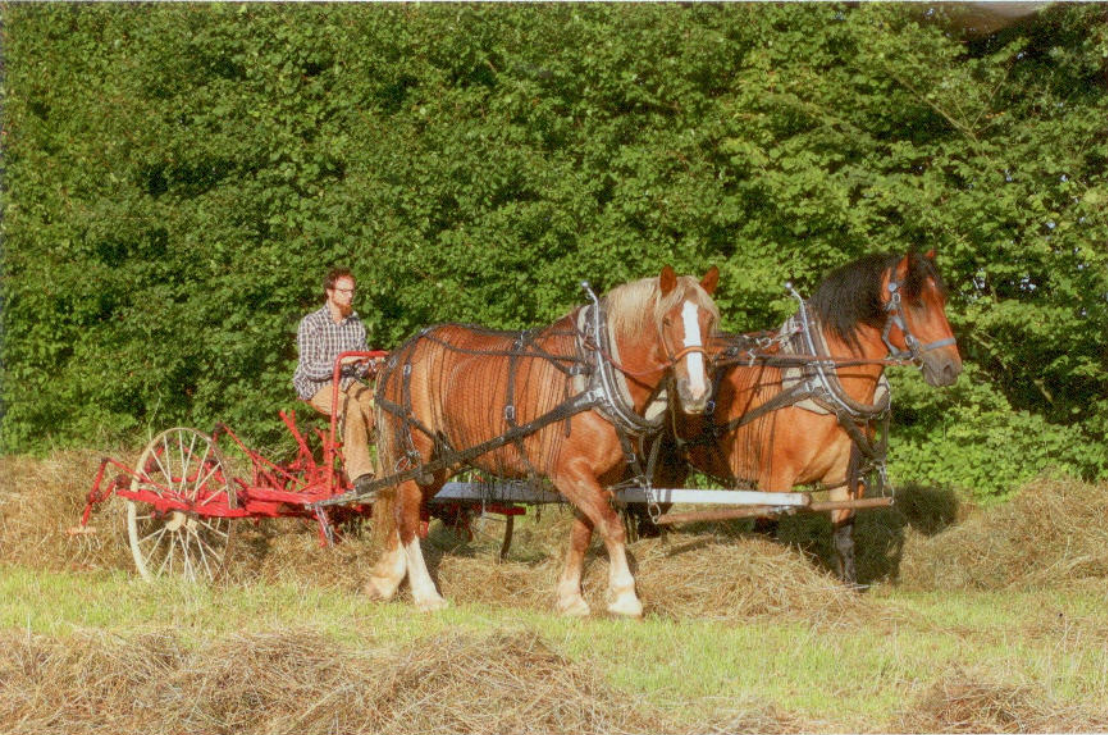
Flamenstute Isis und der Rheinisch-Deutsche Heinrich vor dem achtgabeligen Heuwendler. Etwa die Hälfte des Heus auf dem Tannenhof hat Johannes Kayßer 2017 mit den Pferden gemacht.

Nach der Ernte werden die Kräuter auf dem Tannenhof grob geschnitten, die Stängel mit einem Windsichter herausortiert und die Blätter mit einer Luftentfeuchtungsanlage getrocknet. Abgesackt in 4,5- bis 12-Kilogramm-Säcke warten die Kräuter im Lager auf große Bestellungen verschiedener Abnehmer.